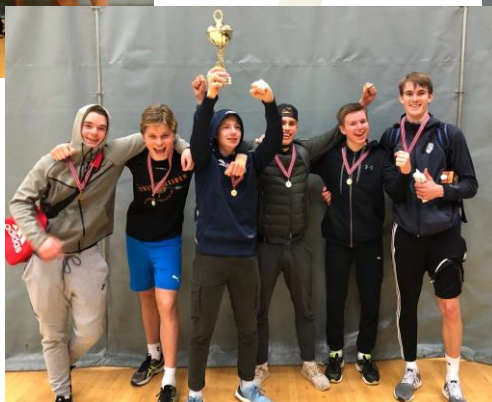
Bilder fra MVGS Hordaland 2018